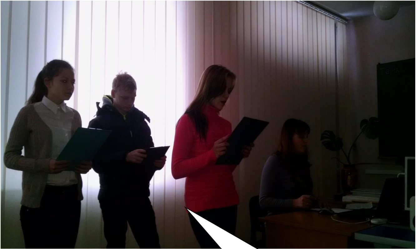
Виступ учнів гр.№157