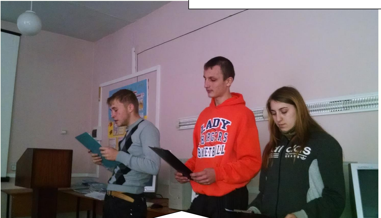
Виступ учнів гр.№155