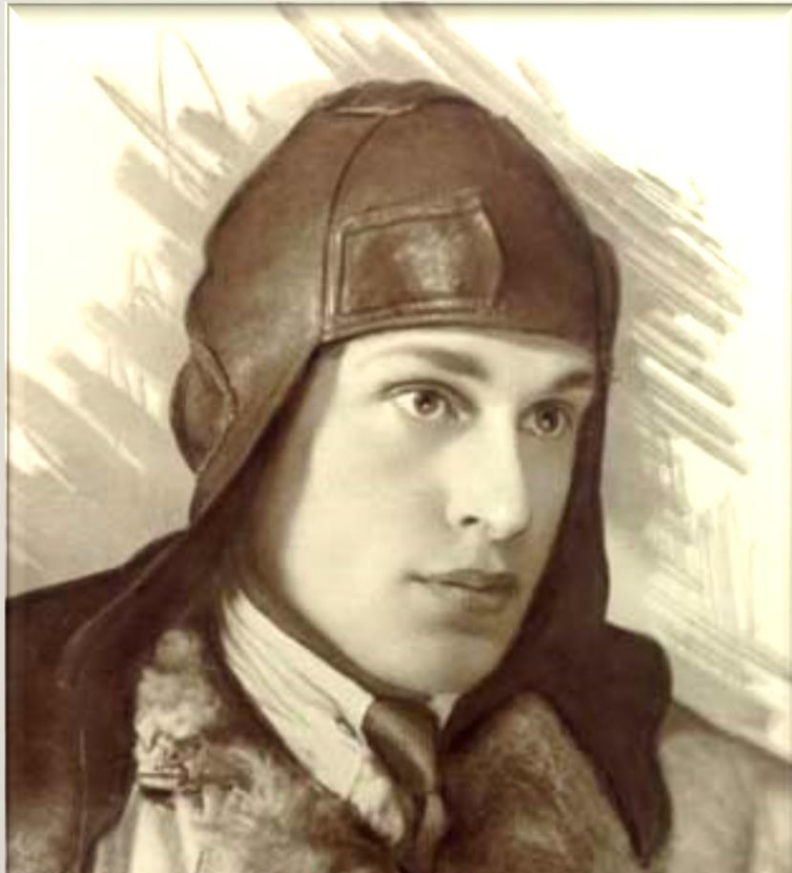
Миколай Михайлович Амосов Репродукція з фотографії грудень 1933 року

1953 – захистив докторську дисертацію з медицини на тему «Резекції легень при туберкульозі»