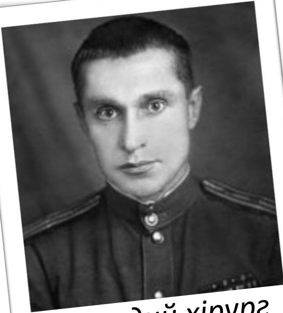
Молодий хірург Миколай Амосов