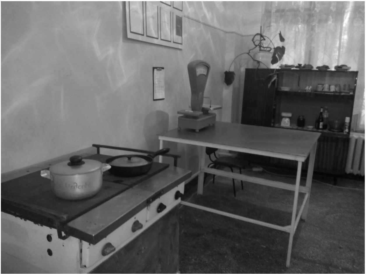
Лабораторія кухарів. 1987 рік.