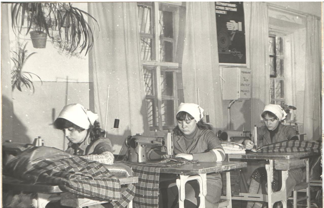
Швейна майстерня. Виготовлення верхнього одягу для учнів професійно-технічної освіти. 1977 рік.