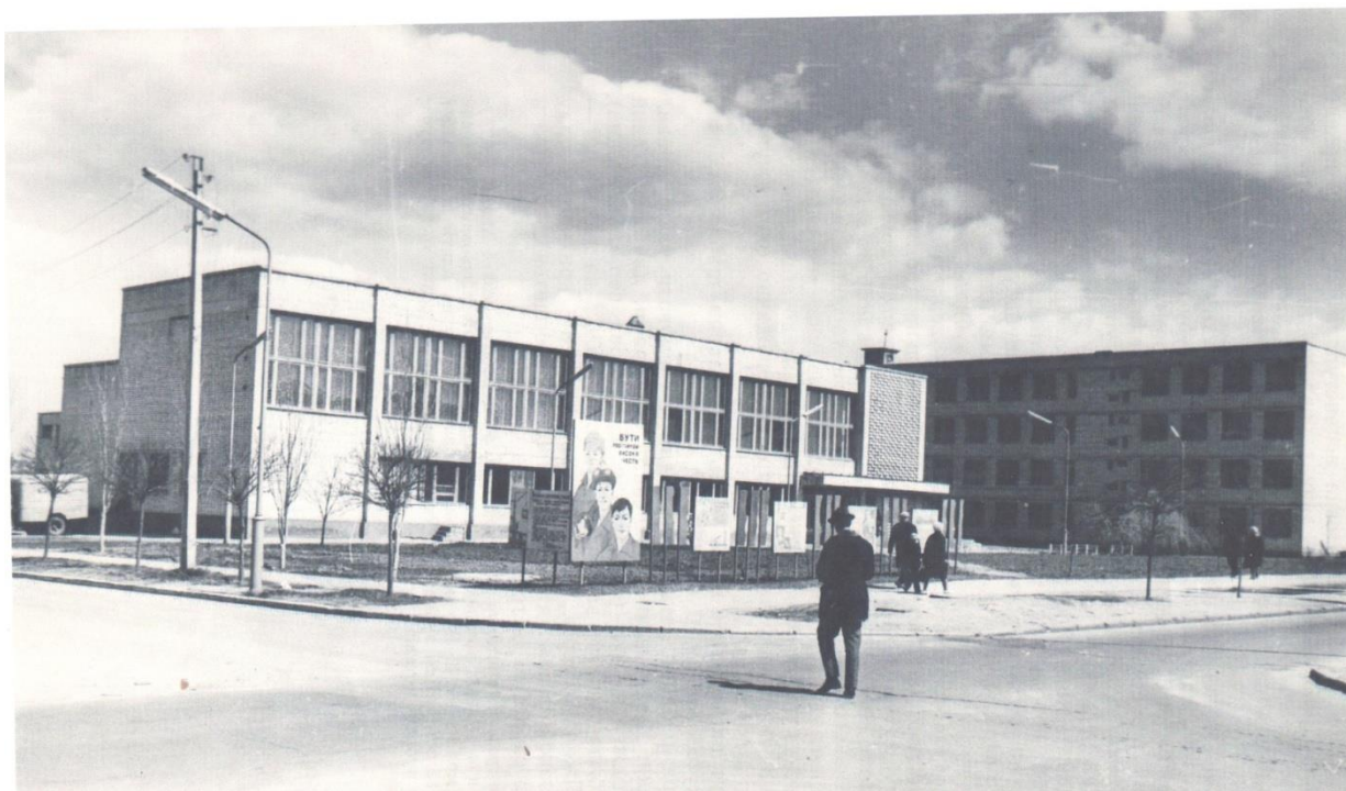
Нікопольське професійно-технічне училище №42. 1968 рік.

Педагогічний колектив навчального закладу докладає зусиль по осучасненню матеріально-технічної бази та впровадженню інноваційних процесів патріотичного виховання молоді.