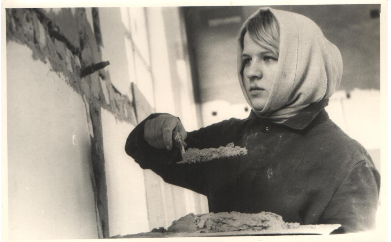
Від учениці до майстра. 1975 рік.