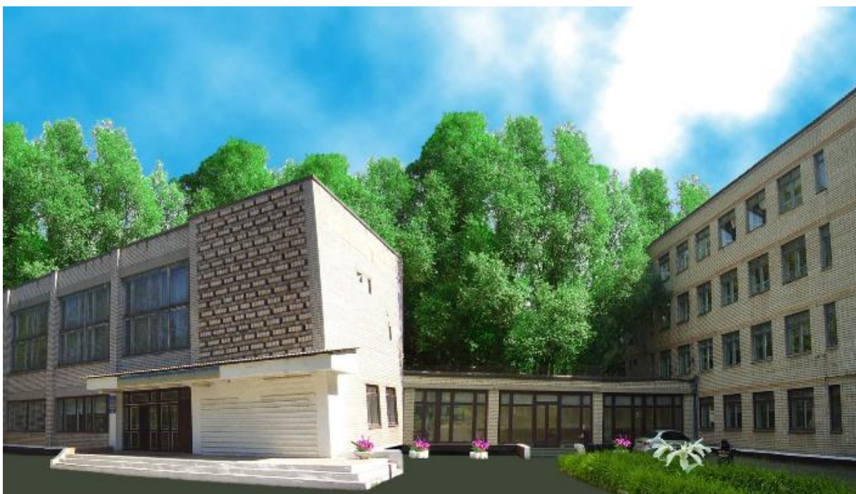
Нікопольський професійний ліцей. 2015 рік.