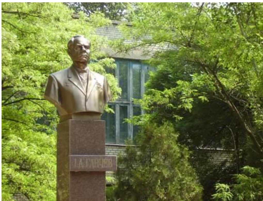
Пам'ятник на подвір'ї НПЛ Ганчеву І.Д. – забудовнику міста Марганець, Нікополь і Орджонікідзе. 2009 рік.