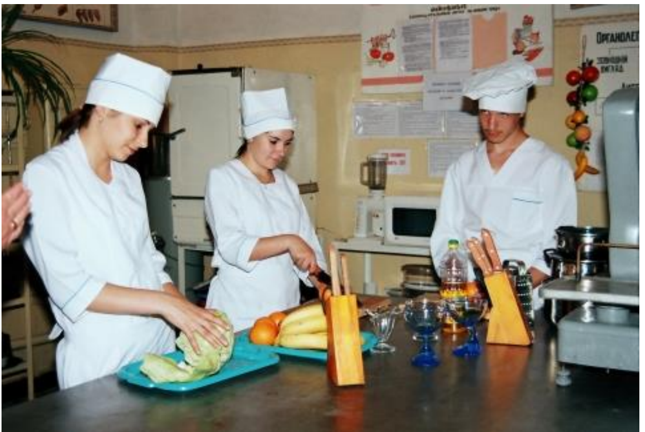
Майстерня-лабораторія кухарів. Обробка овочів для салатів. 2012 рік.