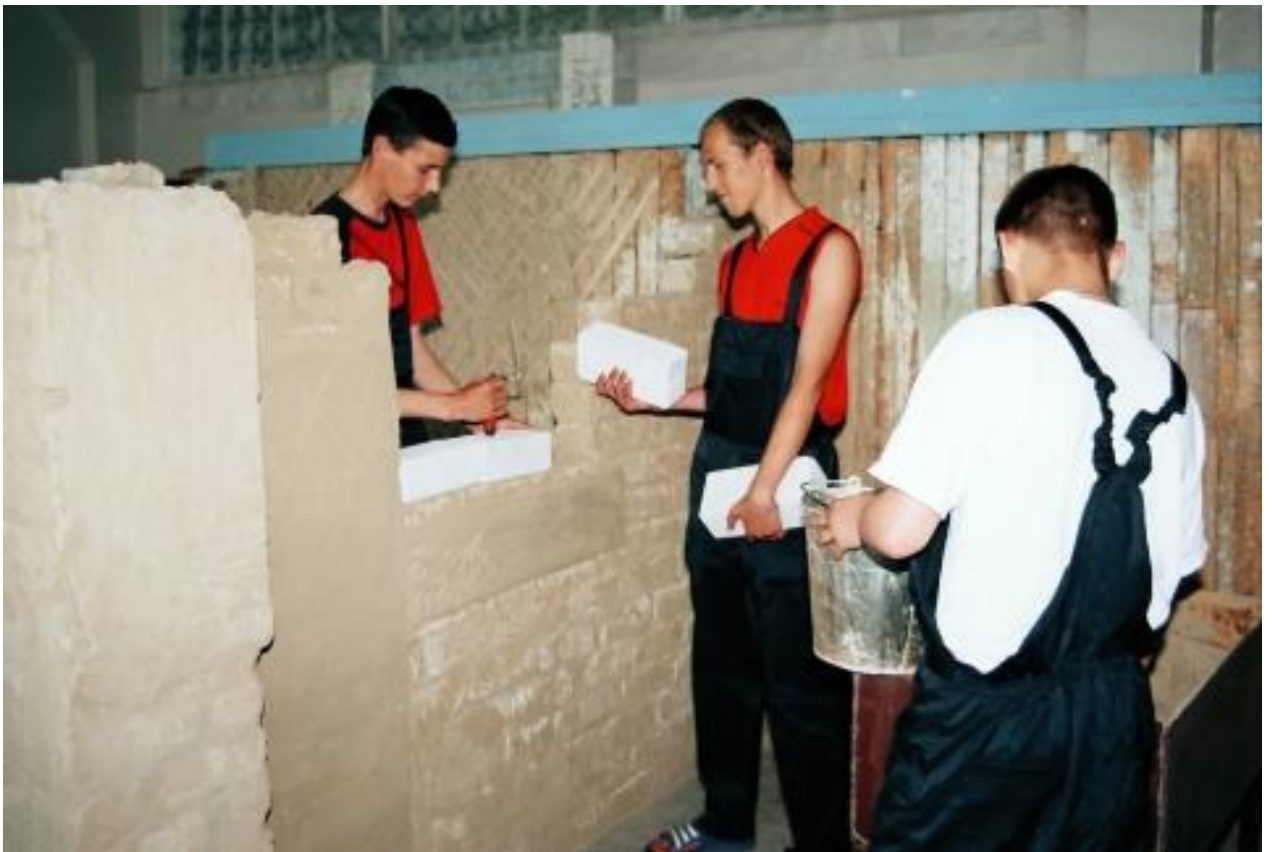
Сучасна майстерня малярів. Кладка цегли. 2014 рік