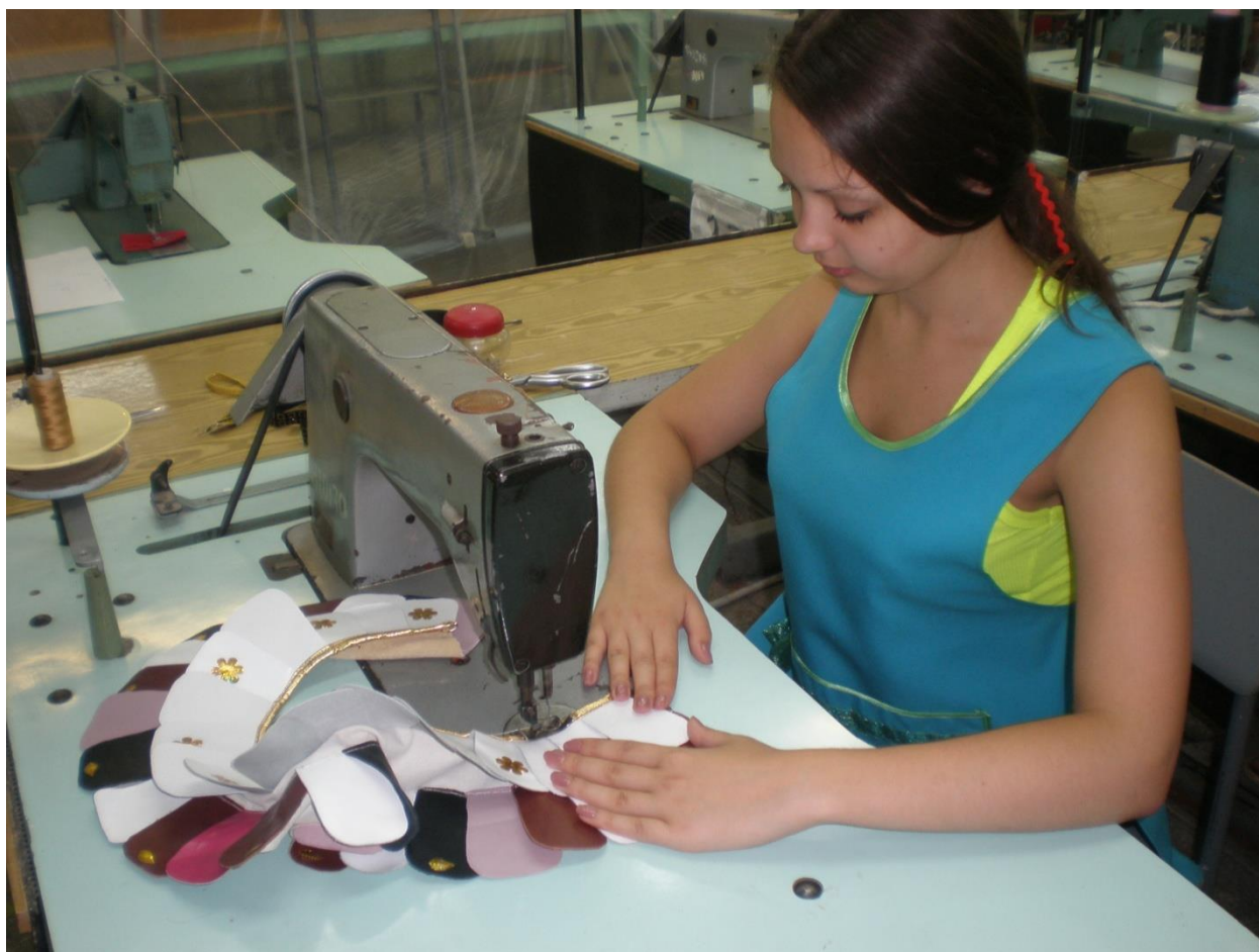
Сучасна майстерня. Сучасні технології виготовлення елементів декору костюмів. Колекція скіфського жіночого одягу. 2014 рік.