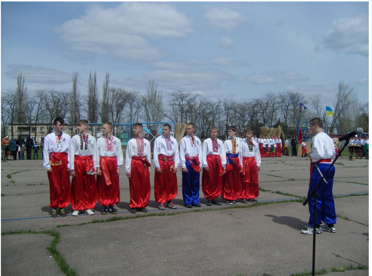
II тур Всеукраїнської дитячо-юнацької військово-патріотичної гри «Сокіл» («Джура»). «Рій» групи 158 «Електрогазозварник. Слюсар з ремонту автомобілів». 2015 рік.