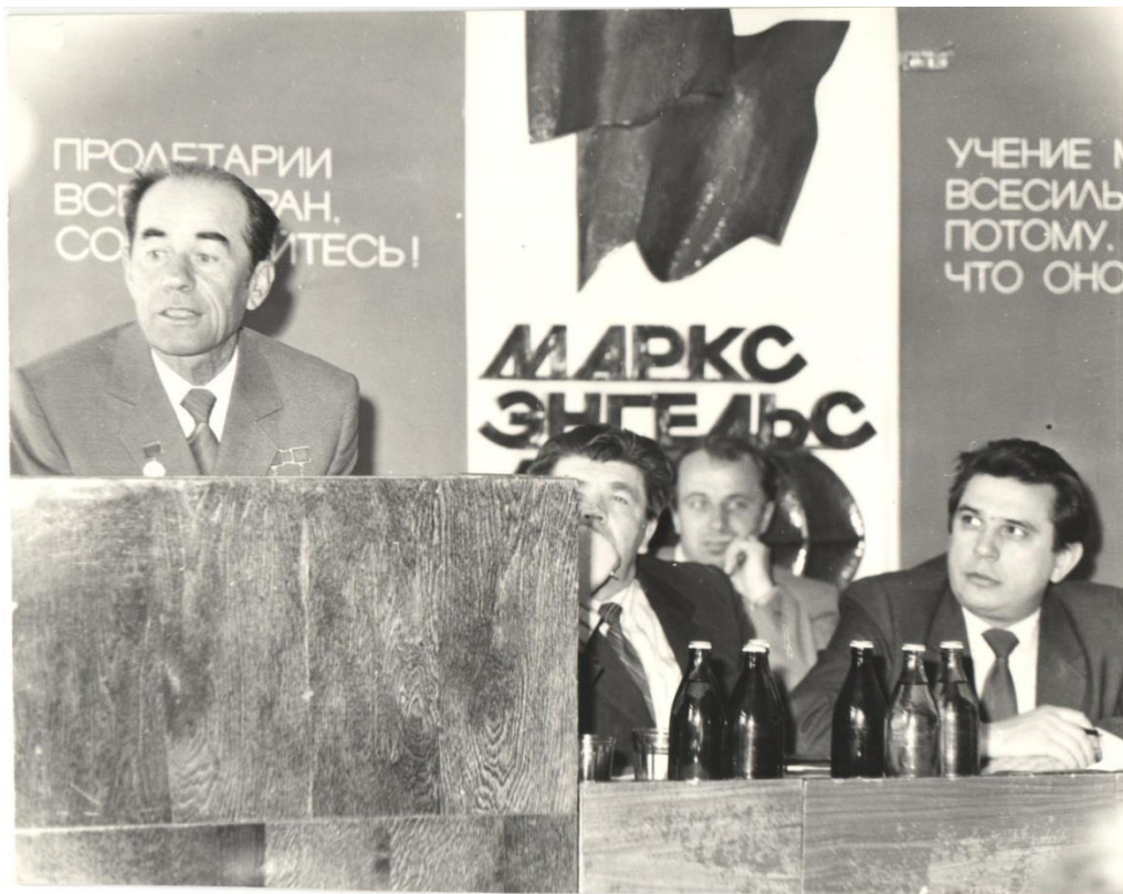
ГАНЧЕВ ІВАН ДМИТРОВИЧ. Двічі Герой Соціалістичної Праці, Почесний громадянин м. Нікополь, Заслужений будівельник УРСР. Виступ в ПТУ №42 перед майбутніми будівельниками. 1984 рік