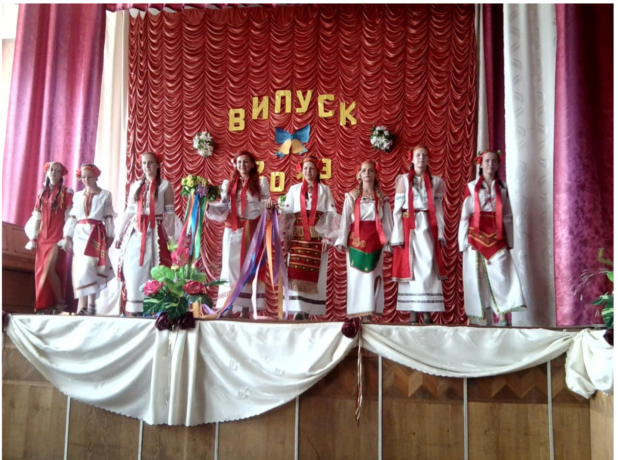
Демонстрація колекції стилізованих українських костюмів перед випускниками ліцею. Ансамбль «Слов'янська веселка». 2013 рік.