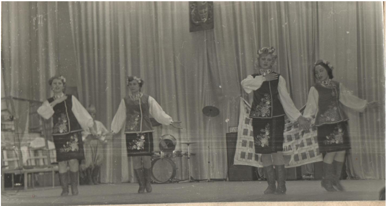
Огляд художньої самодіяльності серед груп професійно-технічної освіти. 1973 рік.