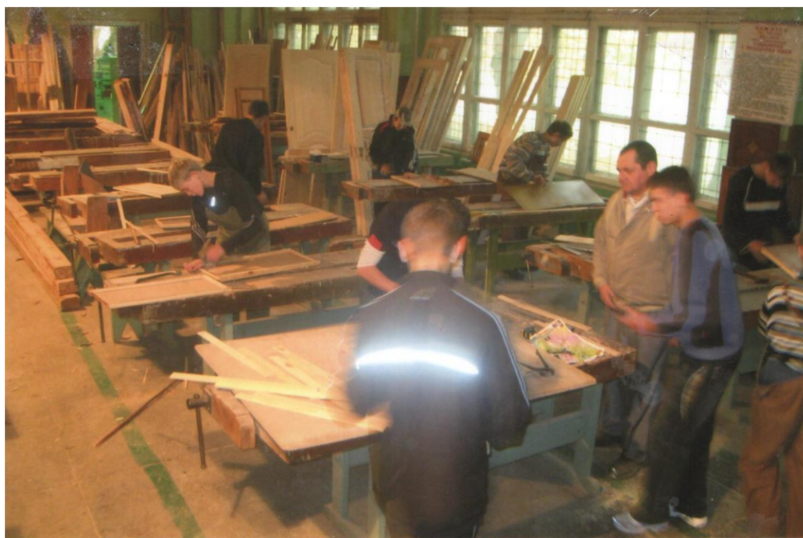
Сучасна столярна майстерня. Виготовлення декоративних полицок. 2010 рік.