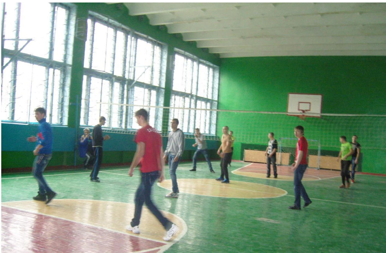
Змагання з волейболу серед учнів I курсу. «Здоров'я дітей – здоров'я нації». 2014 рік.